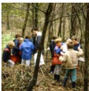
Sortie découverte en forêt