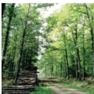
Futaie de chênes - Cl. DIREN

Les biotopes* de petite surface ne sont pas en mesure d'accueillir une population pérenne de cerfs pour des raisons économiques et écologiques.