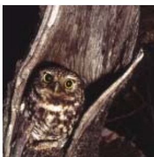
Chouette chevêche Cl. de Gouvion Saint-Cyr