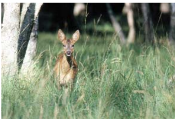
Chevrette adulte - Cl. ONCFS/Barbier