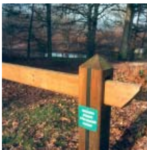
Zone protégée en forêt