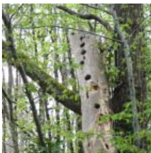
Arbre creux