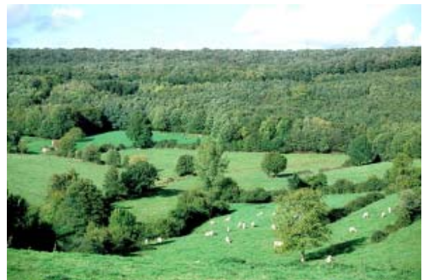
Forêt de Bellême

Le milieu forestier est riche en espèces animales et végétales, d'autant plus nombreuses et diversifiées que le milieu est lui-même diversifié horizontalement et verticalement et qu'il présente de nombreux modes de gestion.