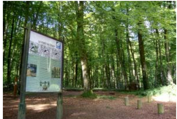
Panneau d'information en forêt de Cerisy - CI DIREN

Depuis quelques années, on assiste à une croissance forte des loisirs utilisant l'espace en forêt publique (sentiers de découverte, randonnée, ballade à cheval, VTT, cueillette des champignons...) qui peut être source de dérangement pour la faune sauvage.