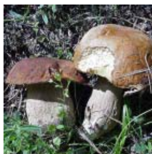
Cèpes